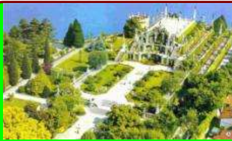
Висячие сады Семирамиды