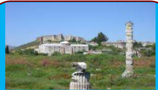
Храм Артемиды в Эфесе