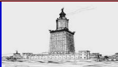
Александрийский (Фаросский) маяк