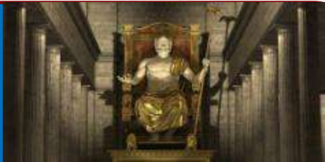
Статуя Зевса Олимпийского